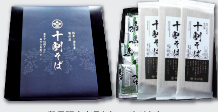
※数量限定商品となっております。