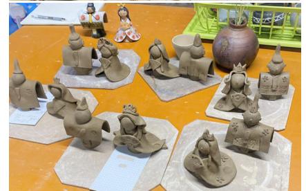
1～2月のお雛様づくり。今から絵付けです。